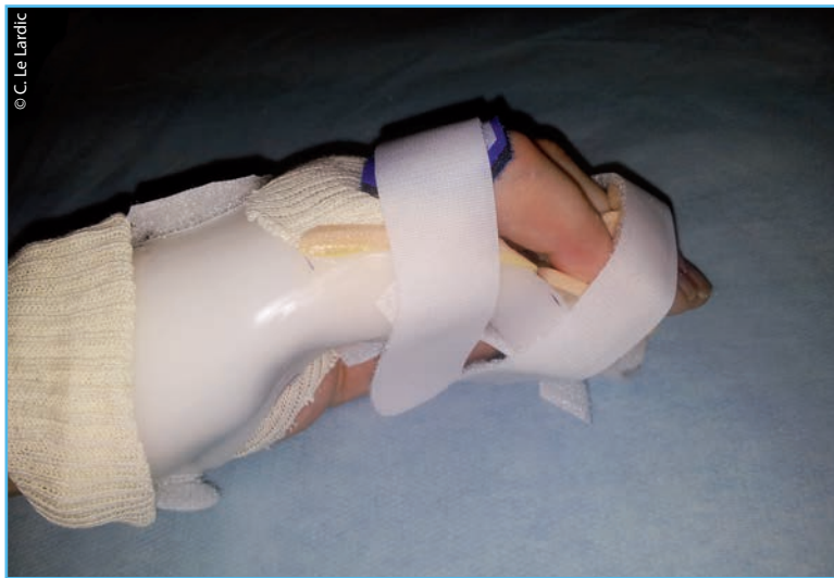
► Figure 3 Orthèse statique

Les ondes de choc et les ultrasons, par leur action inflammatoire sont contre-indiqués dans les deux premières phases du syndrome.