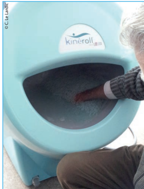
► Figure 2 Hydromassage à billes

C'est un traitement physiothérapeutique très utilisé mais souvent sans protocole. Trois types de courant existent : le courant endorphinique, très basse fréquence, le courant excito-moteur, moyenne basse fréquence et le courant « gate control » haute